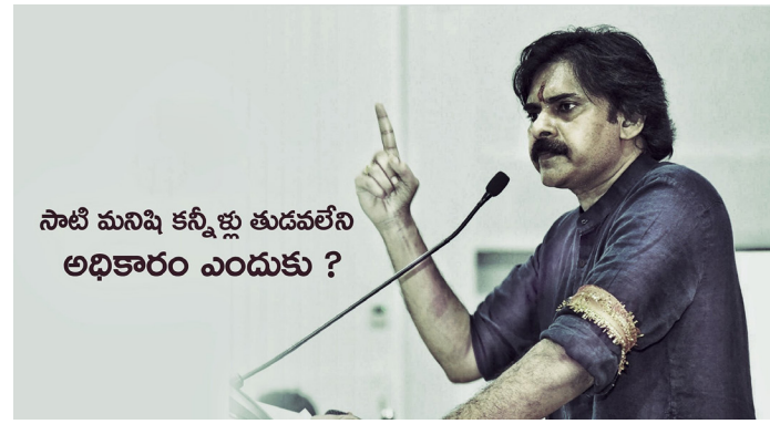
సాటి మనిషి కన్నీళ్లు తుడవలేని అధికారం ఎందుకు ?