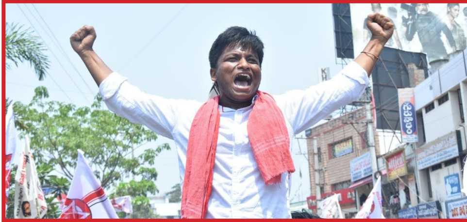
రావాలని ఆసక్తి ఎవరికైనా ఉంటే వారికి జనసేన పార్టీ ఒక మంచి ప్లాట్ ఫామ్.

టీం శతఘ్నిన్యూస్: పవన్ కళ్యాణ్ గారు ఎప్పుడు అంటూ ఉంటారు కేవలం పదవులు ఉంటేనే రాజకీయాలు చెయ్యలేమని, జనంలోకి ఆశయాలను తీసుకు వెళ్ళాలి అని అంటూ ఉంటారు, ఇది ఎంతవరకు నిజంమంటారు?