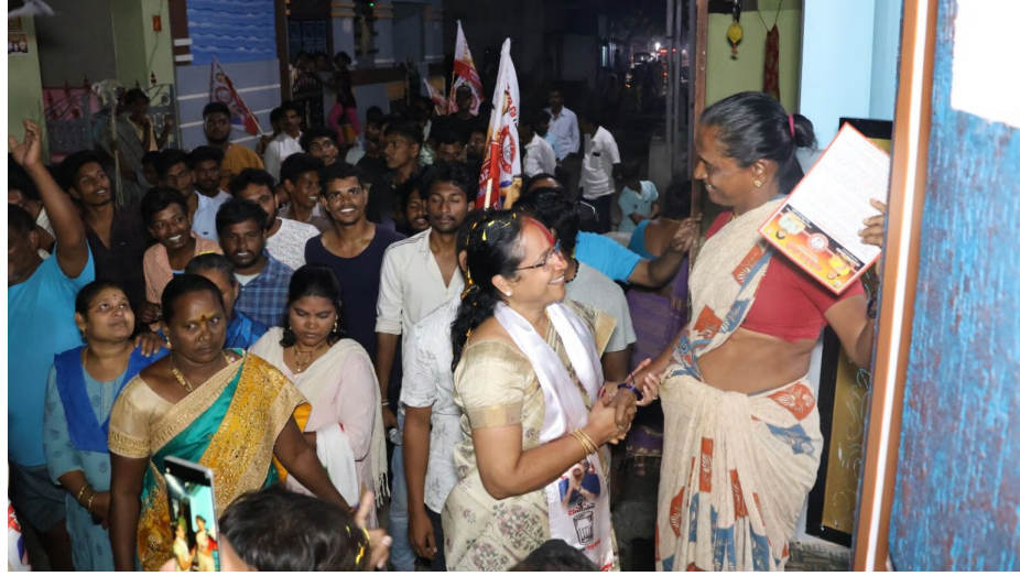
మరియు వితంతువులకు వృద్ధులకు పెన్షన్లు రావటం లేదు. మెరుగైన పరిపాలన సామాజిక నిష్పక్షపాతంగా సేవ చేస్తానని హామీ ఇచ్చారు.