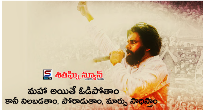
మహా అయితే ఓడిపోతాం కానీ నిలబడతాం, పోరాడుతాం, మార్పు సాధిస్తాం