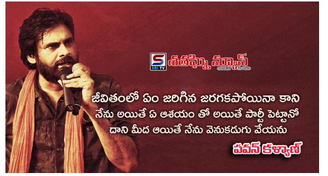
జీవితంలో ఏం జరిగిన జరగకపోయినా కాని నేను అయితే ఏ ఆశయం తో అయితే పాల్గొంటానో దాని మీద అయితే నేను వెనుకడుగు వేయను వైసీపీ కళ్యాణ్