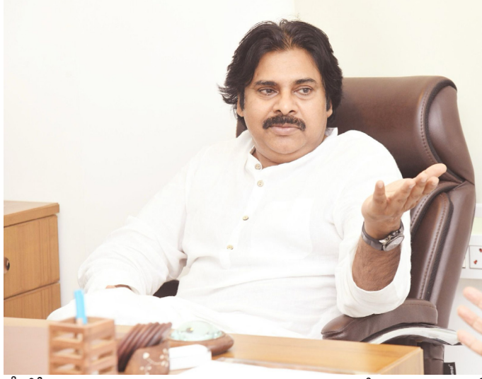
బీజేపీ కార్యకర్తలు, నాయకులు ఈ కార్యక్రమంలో పాలుపంచుకోవాలని కోరుతున్నాను.