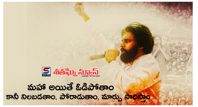
మహా అయితే ఓడిపోతాం కానీ నిలబడతాం, పోరాడుతాం, మార్పు సాధిస్తాం