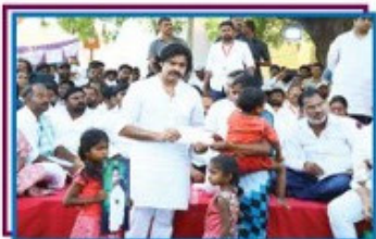
25. ఎ. అంబరి - శంకర