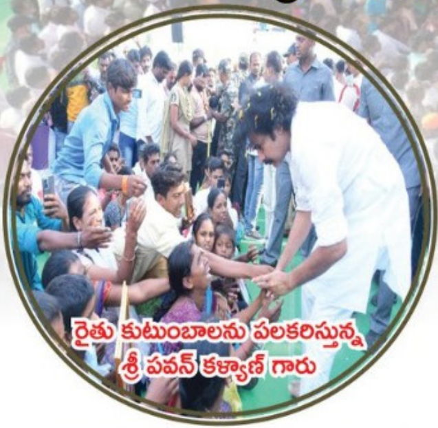
రైతు కుటుంబాలను పలకరిస్తున్న శ్రీ పవన్ కళ్యాణ్ గారు

మొదటి విడతగా అనంతపురం జిల్లాలో 31 కుటుంబాలకు, ఒక్కో కుటుంబానికి రూ. లక్ష సహాయం