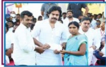
19. దూడేకుల హనుమంతి - బాలదప్పగిరి