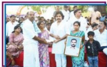
28. పద్ద శ్రీశ్రీ - అంజనేయులు