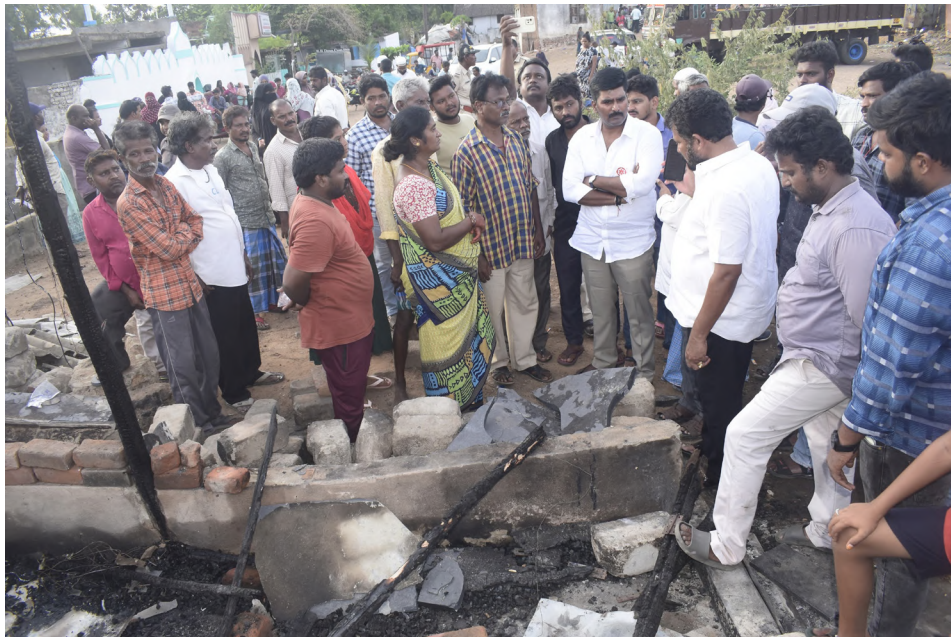
తరపున వీరికి అందాల్సిన ఆర్థిక సహాయం అంతా కూడా ఏర్పాటు చేసే విధంగా ప్రభుత్వం చర్యలు తీసుకుంటుంది. ఇల్లు లేని ప్రతి కుటుంబానికి పిలిచి మరీ ఇస్తానన్న పొంగూరు నారాయణ. కచ్చితంగా ఇల్లు ఇచ్చి వీరిని ఆదుకునే విధంగా జనసేన-తెలుగుదేశం నాయకులు ప్రయత్నిస్తారని తెలిపారు.