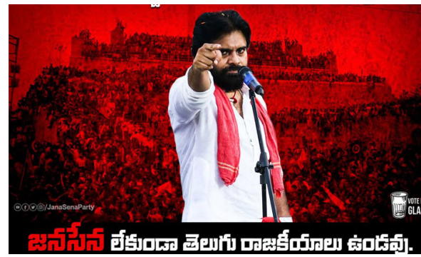
జనసేన లేకుండా తెలుగు రాజకీయాలు ఉండవు.