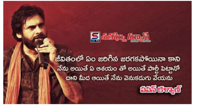
జీవితంలో ఏం జరిగిన జరగకపోయినా కాని నేను అయితే ఏ ఆశయం తో అయితే పార్టీ పెట్టానో దాని మీద అయితే నేను వెనుకడుగు వేయను వినినీ కళ్యాణ్