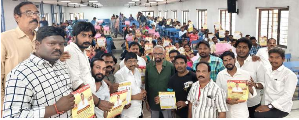
గెలిపించమని గ్రామీణుల ఓటర్లను అభ్యర్థించి కూటమి అభ్యర్థి విజయం కోసం ప్రచారంలో పాల్గొన్నారు.