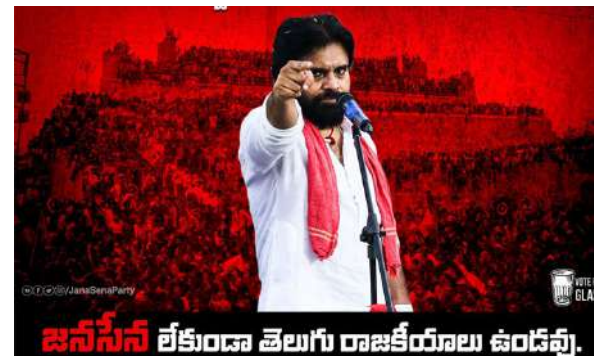
జనసేన లేకుండా తెలుగు రాజకీయాలు ఉండవు.